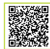
Guía para reciclar

La guía para reciclar resulta una herramienta imprescindible a la hora de informar a la ciudadanía. Durante el 2024 se ha difundido con gran aceptación en numerosos eventos como: plantaciones, formaciones a entidades, talleres en centros cívicos, implantación de sistemas de segregación de residuos en centros educativos, etc.